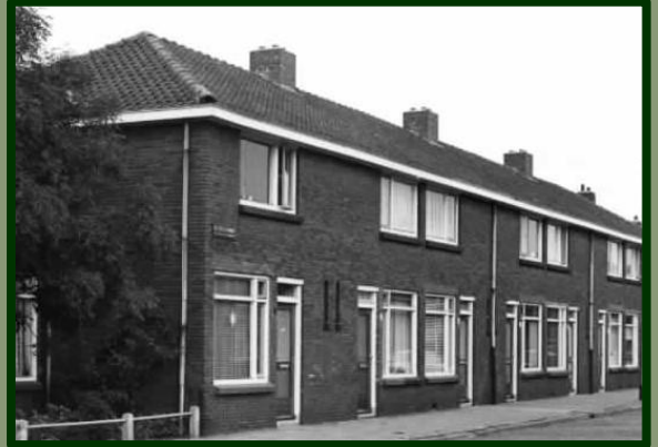
De Bazelstraat in 1976.

De woningen aan deze straat werden gebouwd in opdracht van woningbouwvereniging 'Zuilen'. Deze De Bazelstraat is onderdeel van Complex 2 van deze woningbouwvereniging. Samen met o.a. de La Croixstraat, M. de Klerkstraat, Van der Pekstraat en de Hanrathstraat werden deze straten aangelegd op een opgespoten stuk zand . Het hele complex lag nogal geïsoleerd en kreeg de wijkaanduiding: 't Zand.