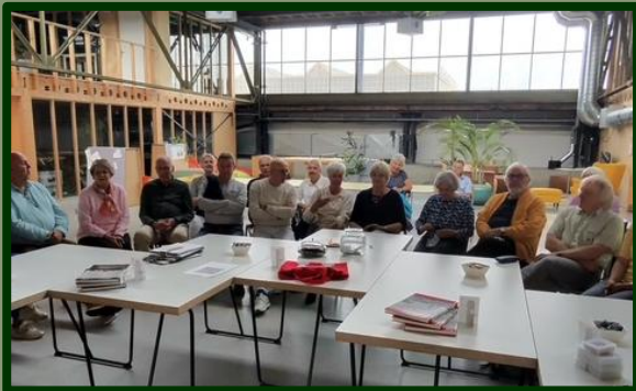
In een ruime kring zittend kon iedereen de presentatie goed volgen. Nadeel is dan wel dat niet iedereen op de foto staat...

De Sweder van Zuylenweg StraatReünie werd goed bezocht, we wijkten uit naar de Westvleugel om iedereen een goede plek te kunnen bieden. Mooie mix van nieuwe- en voormalige bewoners. Zij hebben een gezellige middag beleefd.