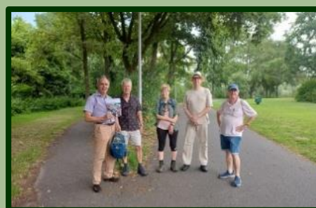
Ook in de vakantiemaand werd gewandeld.