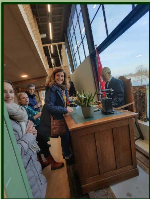
Onder toezien oog van de replica-burgemeester werden heel veel foto's gemaakt.