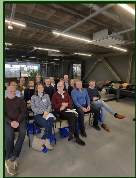
Geïnteresseerd over de bijzondere groei van Zuilen.