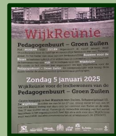
Flyer die huis-aan-huis in de Pedagogebuurt – Groen Zuilen werd verspreid.