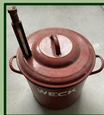
Weckketel mét thermometer.

Bij M. van Rooijen een kofferbak vol met ham-kookpannen en leverkaas pannen gehaald, ooit gebruikt door Zuilense slagers. Ook een wasketel – gebruikt in de wasserij die zijn vader begon in Zuilen – en een weckketel, die door zijn moeder gebruikt is.