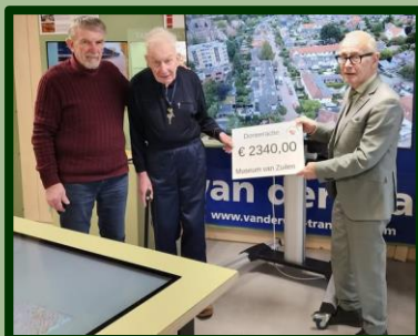
Betrokken met het voortbestaan van het Museum van Zuilen werd de cheque aangeboden door de heren Achterberg.