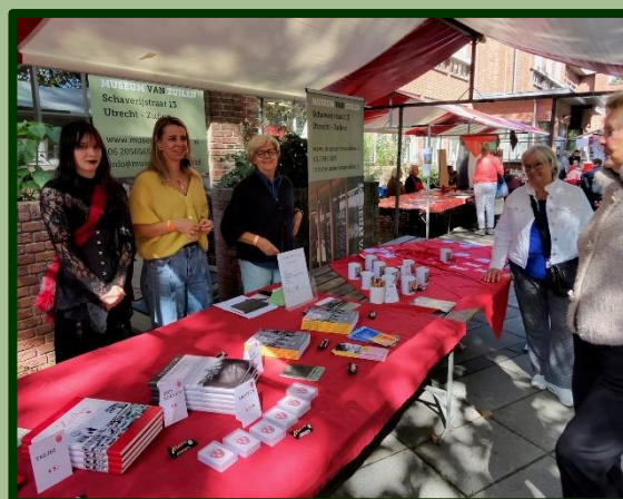
Op het festivalterrein was het MvZ ook present met een kraam voor publiciteit.