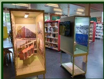
Mooie maquettes van verschillende woonblokken verfraaien het geheel.