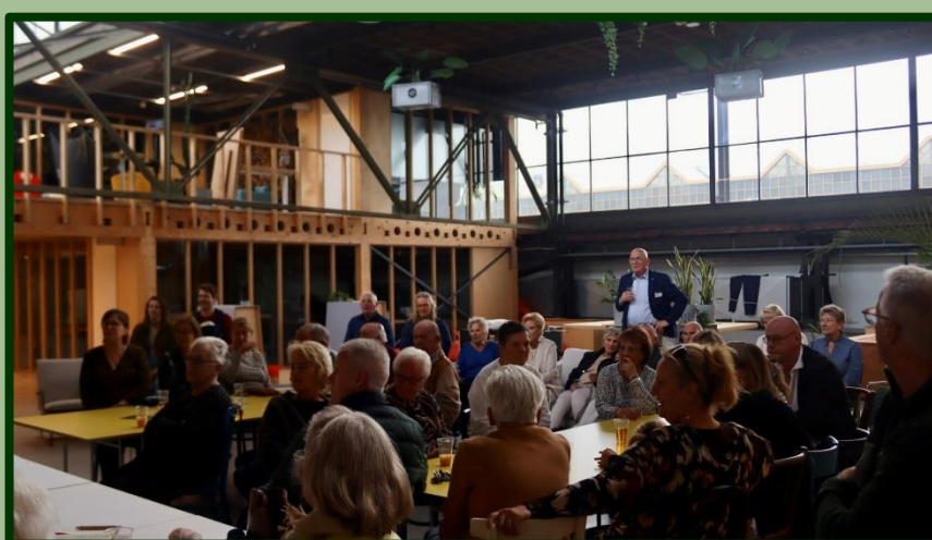
Wéér werd uitgeweken naar de Westvleugel om de grote schare bezoekers plek te kunnen geven.

2 StraatReünie voor de huidige en oud-bewoners van de Balderikstraat. Met ruim 55 bezoekers de reünie-topper van het jaar.