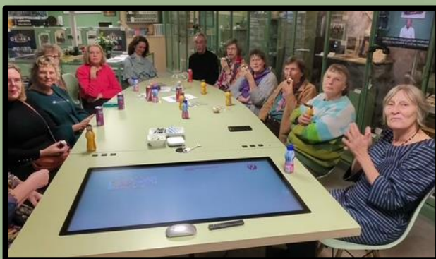
Het gezelschap volgde geboeid de presentaties over Werkspoor en de Prinses Irenelaan.

2 StraatReünie voor de huidige en oud-bewoners van de Balderikstraat. Met ruim 55 bezoekers de reünie-topper van het jaar.