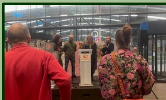
De wethouder opent..