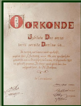
Honderd jaar geleden geschreven oorkonde.

Na het aanbod om deze te vervangen door een goede replica kreeg het Museum van Zuilen het origineel.