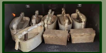
Grote en kleine pannen voor de ham en twee stuks voor leverkaas.

Er lag nog meer op zolder: kookpotten voor ham en leverkaas, afkomstig van de slagerijen Bosch en slagerij 'De Tijdgeest', een kofferbak vol.