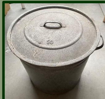
De 50-liter ketel werd slechts kort gebruikt en is nog mooi gaaf gebleven.

Daar kwam een en ander uit tevoorschijn! Wat te denken van de wasketel die ooit werd aangeschaft door zijn vader die het bedrijf begon.