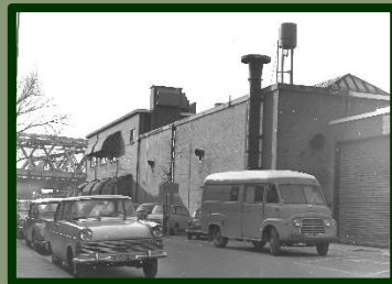
De Muyskenweg met rechts de Demka fabrieken.

Aanmelden wordt zeer op prijs gesteld: bel hiervoor even naar 06 20565655 alstublieft.