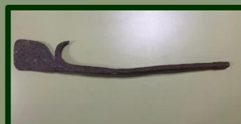
Het is nogal een pook, en dan te weten dat er een groot stuk afgezaagd is! (de ovens waren nogal diep).

Bijzonder – en dát is het – ook deze maand weer heel veel 'nieuwe' dingen in ontvangst te mogen nemen. Zoals gezegd, de klok, maar wat ook bijzonder is, de bijdrage van de heer Wilke: stempels, een dakvorst (met ophangblokje), de houten (gebarsten en met ijzerdraad gerepareerde) pollepel om water bij de klei te scheppen en de pook waarmee de ovens van de 'Pannenfabriek Gebr. Weener' werd opgepookt.