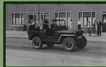
Brandweerauto én bijl. Tot nu toe is alleen de bijl in de collectie.

Enne, we kregen ook nog een prachtig album met 36 foto's ('een heel rolletje mijnheer') van een toneeloptreden van de toneelclub van 'Het S.E.B.', geschonken na afloop van de lezing die het Museum van Zuilen daar hield ter gelegenheid van het 80-jarig bestaan.