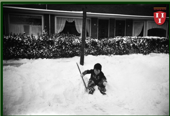
Maar... als er sneeuw op de stoep ligt komt het wel weer goed