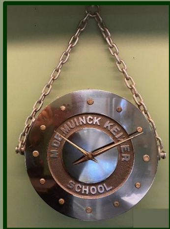
Heel wat uurtjes noeste vlijt in beeld. De klok van de Demka bedrijfsschool.

Een prachtexemplaar, die dan ook onmiddellijk een plaats kreeg in de huidige tentoonstelling.