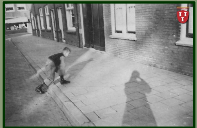
Knikkeren op straat, ook een verdwenen fenomeen.