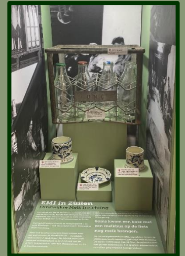
Een kijkje in één van de vitrines in de bieb van Zuilen. Ingericht met informatie en stukken van de 'Elinkwijkse Melk Inrichting', de E.M.I.

onze tentoonstelling kunt u ook in de bibliotheek terecht.