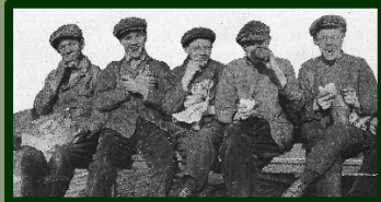
Minder hoog, maar dan wel honderd procent Werkspoor!

Een foto die tot de verbeelding spreekt. Van een groep Werkspoorders werd in de jaren dertig van de vorige eeuw een foto geplaatst in het blad 'Utrecht in woord en beeld'.