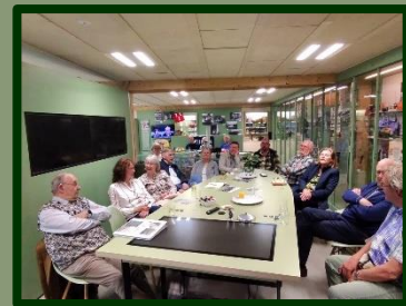
Er werd nog lang over nagepraat, het was een zeer gezellige StraatReünie.

Daarom is het ook zo leuk om te organiseren: het bezoek van de StraatReünie beleeft heel veel plezier aan het weerzien van oude bekenden, het kennismaken met de bewoners 'die nú in hun huis wonen' en genieten van de lezing met het verhaal over het ontstaan van Zuilen en hún straat.