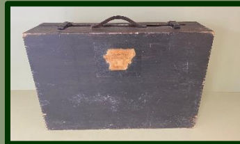
Het 85 jaar oude vluchtkoffertje van A. Overes.

Ook de bijdrage van de heer Valkenburg is het vermelden waard: het zogenoemde vluchtkoffertje van zijn schoonmoeder, mevrouw Overes. Mevrouw A. Overes, Dieselweg 8, Zuilen gaf gehoor aan het advies van de overheid vóór en tijdens de Tweede Wereldoorlog: zet een koffertje klaar met noodzakelijk bezit, dat u meeneemt in geval van evacuatie of als u moet vluchten voor het oorlogsgeweld.