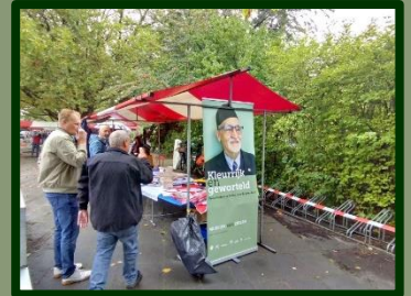
Onze kraam op het ZON-festival.

De kraam werd goed bezocht -en goed bemand door de vele vrijwilligers!