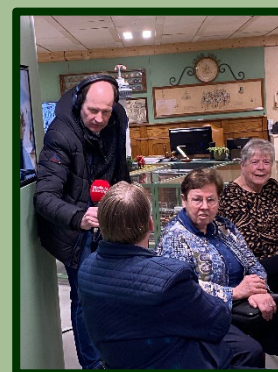
Bezoekers werden live geïnterviewd voor het programma 'Aan tafel', van Radio M.