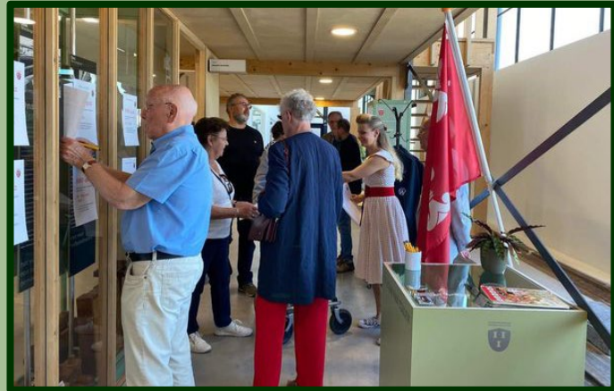
Aan de quiz werd door alle bezoekers met veel plezier deel genomen.