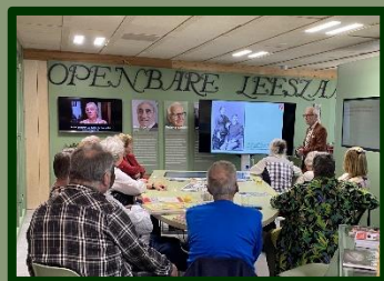
De lezing is nog maar net begonnen maar men zit al op het puntje van de stoel.

Als de groep niet zo heel erg groot is dan is het prima te doen om in de museumruimte de presentatie die 'hoort' bij de StraatReünie te houden.