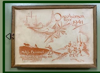
De achterkant van het lijstje die het zo mooi maakt.

spelende kinderen, zaiende en ploegende boeren, een duif met de vrede-stak in zijn bek en de tekst: 'Onze wensen voor 1941'. Dat alles gedrukt met oranje inkt, een mooie vorm van vertrouwen in de toekomst!