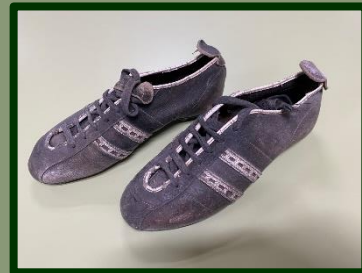
De voetbalschoenen zijn niet zó bijzonder, de gevolgen van het krijgen wel!

In de vorige Zuilense Nieuwsbode hebben we al aangegeven dat u deze filmpjes allemaal terug kunt kijken via YouTube . Als u zoekt naar U in de Wijk Zuilen vindt u ze vanzelf.