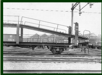
De Duitse autotransportwagen op het terrein van Werkspoor.

staat ook al jaren zo'n wagen in miniatuur op onze Werkspoor-tafel. (Nu nog gevuld met Volkswagens , maar daar komt nu natuurlijk verandering in: we gaan op zoek naar de Daf 33 in schaal HO.)