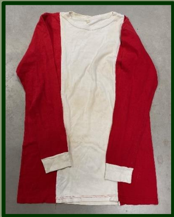
Het HMS-shirt dat we kregen.

En had ik al verteld van die man die binnenstapte met in een plastic tasje zijn sportshirt van HMS (en Holland, maar dat vermelden we natuurlijk niet, dat is geen Zuilense club.)