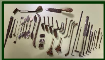
Zo zien 37 stukken vormers-gereedschap er dus uit.

Net als de uitbreiding die we vrijdag kregen van de zoon van een 'Demkaan' (voor de jongere onder u, zo werden de medewerkers van de Demka staalfabrieken genoemd) maar liefst 37 stuks vormers-gereedschap . Hebben we er honderden van, maar ook nu zaten er stukken bij die nog niet in de collectie voorkwamen.