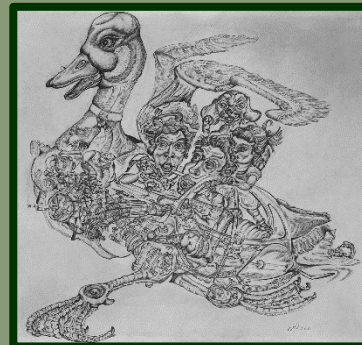
Zoomt u eens in op dit plaatje, en verbaas u over de complexiteit van deze tekening.