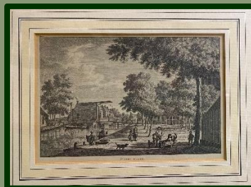
De kopergravure is aan de achterzijde voorzien van een certificaat van echtheid.

Bijzonder was ook de pentekening in lijst die we kregen aangeboden. 't dorp Zuilen', een kopergravure van omstreeks 1760, zoals die voorkomt in het boek 'Verheerlijkt Nederland'.