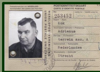
En bij dit verhaal kregen we ook een afbeelding van zijn identiteitskaart.

Uit deze opsomming blijkt hopelijk al een beetje dat we met onze uitspraak: 'We krijgen er iedere dag wel weer dingen bij', niet overdrijven. Dan is het volgende verhaal ook leuk: