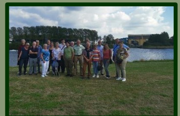
Dat wordt al met al een hele club, museumgidsen en vrijwilligers die zich inzetten voor het behoud van het Museum van Zuilen Samen met een aantal bestuursleden gingen zij op de foto, met op de achtergrond de Werkspoor-kathedraal.

hebben er een mooi feestje van weten te maken. Het kwam daarnaast bijzonder goed uit dat juist deze middag, in het kader van 900 jaar Utrecht een boottocht te boeken was, vanuit de Werkspoorhaven, naar de overzijde waar de kunstenaar Ruud Kuijer uitleg kwam geven over de door hem (in de Werkspoor-kathedraal!) gemaakte betonnen sculpturen die langs het Amsterdam-Rijnkanaal staan. Na afloop werd er geborrelt bij café De Leckere aan de haven. Een middag om in te lijsten. Dank aan de vrijwilligers!