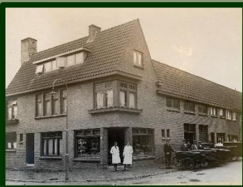
Het pand van bakker Amsing, nog zonder het wapenschild.

De restauranthouder als restaurateur, het kan dus echt, en het resultaat is bijzonder mooi geworden.