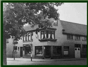
Iets later in de tijd: een statieportret van het pand, nu mét het wapenschild.

uitgroeide tot het nog steeds bestaande verhuisbedrijf Van Haarlem in De Meern.