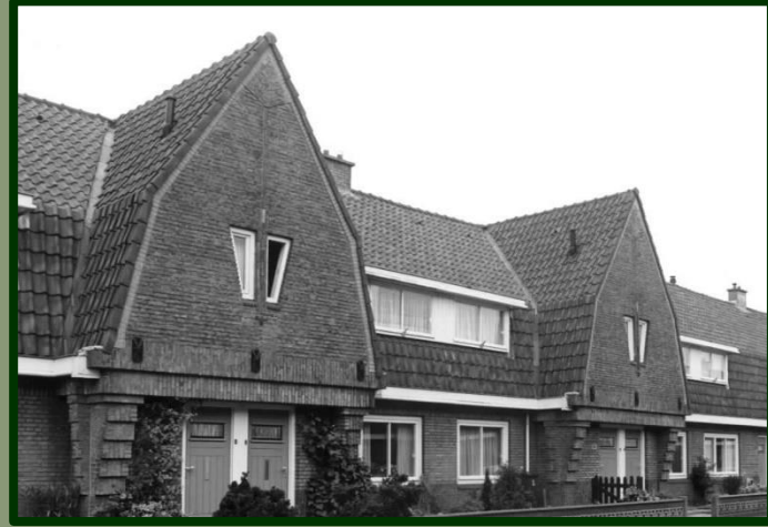
De Abraham Kuypersstraat.

De StraatReünie begint om 14:00 uur. Na een uurtje kennismaken met elkaar, start om 15:00 uur een kleine lezing over Zuilen in het algemeen en de Abraham Kuypersstraat in het bijzonder. Om 17:00 uur sluiten we af.