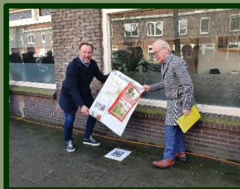
Daar is de tegel met het verhaal. Met dank aan de huidige gebruiker van het pand: garage van Angeren, met ook een lange geschiedenis in Zuilen, en óók een garage in een voormalig pand van Amsing!

Toch was de koek nog niet op. Bij het praatje na de onthulling werd en-passant een archiefdoos naar mij toegeschoven. Hierin zaten vele officiële documenten die de annexatie van Zuilen betreffen. Ook hierin zitten prachtige plattegronden, getekend in de aanloop naar de annexatie.