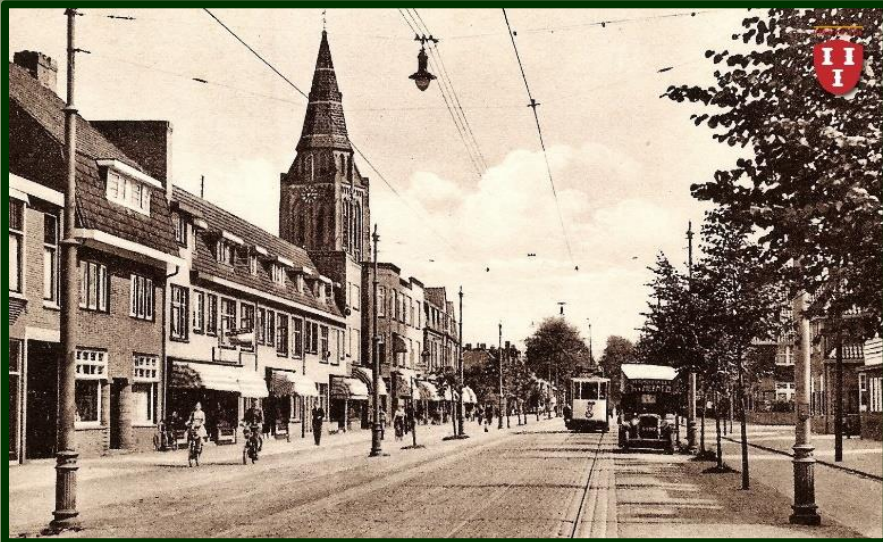
Een vooroorlogse afbeelding van de Amsterdamsestraatweg vanaf nummer 605 (links).

Nu komen we bij de woningen van woningbouwvereniging 'Zuilen' en het einde van deze beschrijving deel 2.