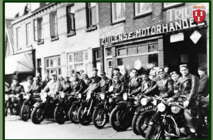
'De Zuilense Motorhandel'

Op nummer 803 zat de montagewerkplaats van de heer P. Dolman. In dit pand kwam later de Zuilense Motorhandel van Luca te zitten.