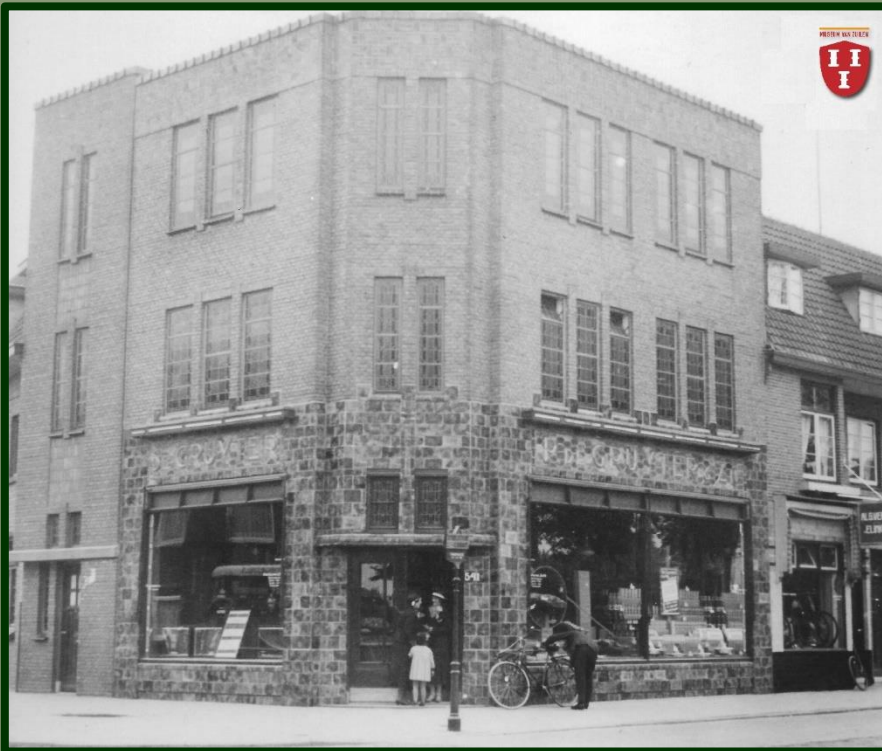
Het pand van P. de Gruyter & Zn op de hoek bij de Sweder van Zuylenweg. Men verkocht uitsluitend 'eigen merk'-producten. De fietswinkel rechts werd later schoenenwinkel 'Het Panterhuis'.

Samen met de in Nederland ongeveer bekendste reclame voor 'Het snoepje van de week' was de succesformule compleet.