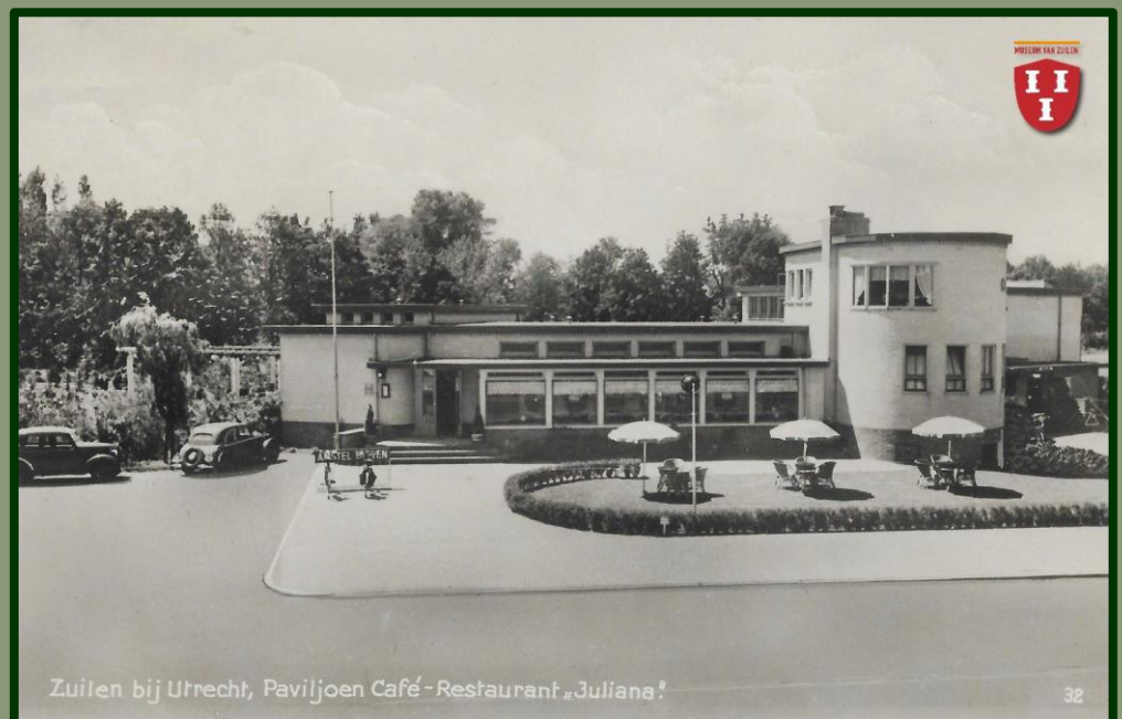
Het Juliana 'Paviljoen' kort na de oplevering.

Dit alles dus volgens de gegevens aan de hand van de stratengids van Zuilen .