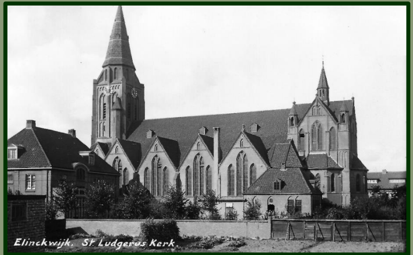
De St.-Ludgeruskerk en pastorie (l) zijn [eind jaren zeventig van de vorige eeuw] gesloopt