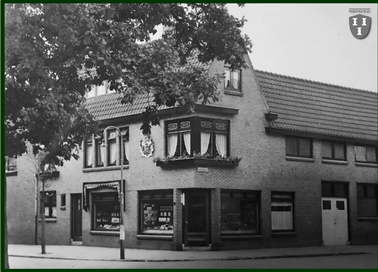
Bakkerij Amsing op de hoek Edisonstraat/Ampèrestraat. Het bord 'Hofleverancier' is gerenoveerd en wordt in 2022 onthuld.