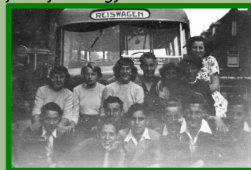
Glunderende gezichten: het jaarlijkse dagje uit gaat beginnen voor de leden van Zuilens Vreugd (alleen voor de bewoners van de Edisonstraat en de Balderikstraat).

naar de bestemming van hun jaarlijkse dagje uit.