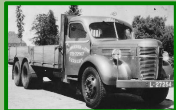
Vrachtauto's van Van Angeren vervoerden vooral bakstenen.