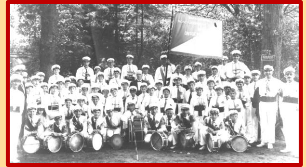
Leden van mondaccordeonvereniging 'Ons Genoegen'