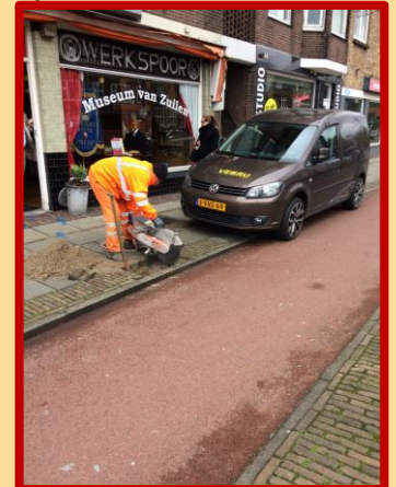
Het Museum van Zuilen treedt steeds meer naar buiten...

Gelukkig was een medewerker van de gemeente zo alert om niet alle te vervangen putten weg te gooien, hij liet er een plaatsje voor de ingang van het Museum van Zuilen. Zijn we blij mee!