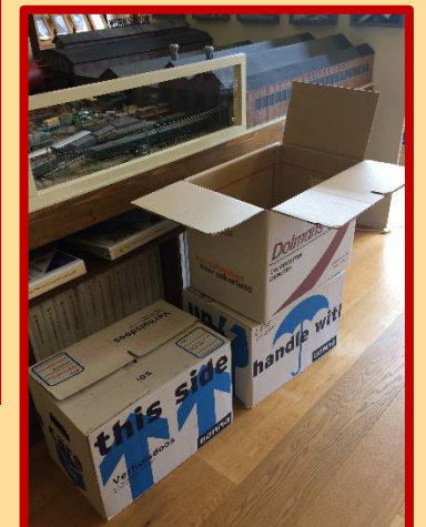
De eerste verhuisdozen zijn gevuld.

U heeft er al verschillende keren over kunnen lezen in vorige Zuilense Nieuwsbodes, maar het bericht is nu officieel: de gemeente Utrecht heeft de toezegging gedaan voor de financiële ondersteuning voor het verhuisplan van het Museum van Zuilen. Er moet nog wat water door de Vecht (denk ik toch, want het wordt tweede kwartaal 2019) maar alle hobbels lijken nu genomen en de definitieve toezegging is er.