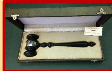
De voorzittershamer met gravure: GRONINGEN EN OMMELANDEN. Deze was voor de voorzitter van de Toneelgroep der vereniging.