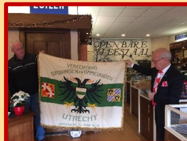
Het vaandel van de Vereniging Groningen en Ommelanden te Utrecht, dat in 1927 aan het bestuur werd aangeboden.