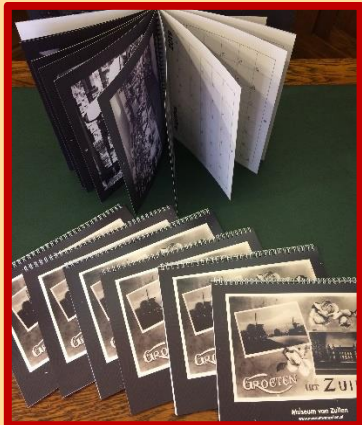
De kalender van Zuilen, nog enige exemplaren te koop!

De kalender is gratis voor donateurs M, L en X, en te koop voor 12,50. Verzenden van de kalender kost € 3.