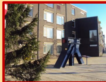
Op de hoek Amsterdamsestraatweg en St.-Ludgerusstraat

U kunt het bijna niet gemist hebben: het 'stukje' van de Bommelse brug, dat we kregen van de gemeente Neerijnen staat op zijn plek. Midden in de wijk waar de mannen woonden die eraan werkten!