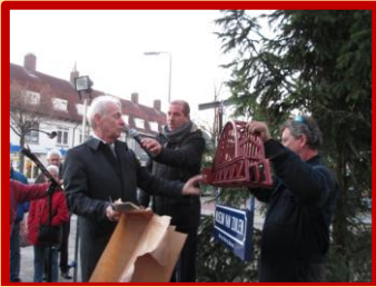
U kunt aan mijn 'blij verrast'-gezicht zien dat ik echt van niets wist. Maar als u goed kijkt ziet u ook hoe blij ik hiermee ben! Een prachtig geschenk!