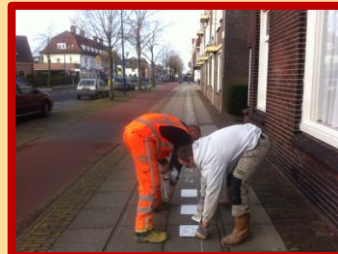
Stap voor stap, richting Museum van Zuilen

Het bleef niet bij 'alleen het brugdeel': om de link met het Museum van Zuilen te versterken werden 'voetstappen' aangebracht, van het brugdeel naar het museum. Werkmanschoenen, met kindervoetjes ernaast: kom, en neem uw (klein)kind mee naar het Museum van Zuilen voor het verhaal bij dit stuk van de brug.