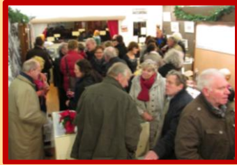
Pas toen het even wat rustiger werd kreeg ik gelegenheid tot het maken van deze foto