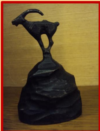
De tafelbel met het prachtige geluid, gemaakt bij... Werkspoor!

WERKSPOOR GIETERIJ MODELMAKERIJ staat duidelijk in de binnenkant vermeld. Prachtig geluid, en dus graag aangeschaft omdat het een mooie aanvulling vormt op de tentoonstelling 100 jaar Werkspoor te Utrecht.