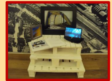
De presentatie van een der kunstenaars in het Museum van Zuilen

Deze tentoonstelling duurt tot en met april volgend jaar.