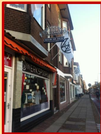
Met trots presenteren wij u...

Het mag duidelijk zijn dat we hier heel blij mee zijn. Hartelijk dank aan de schenkers en medewerkers die dit mogelijk hebben gemaakt.