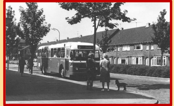
Eindpunt voor lijn 3

Ook dit keer weer een echt ‘Museumweekend’, want op zaterdag 8 december herhalen we de StraatReünie van de De Lessepsstraat. U moet dus wel een heel goede reden hebben als u een van deze beide dagen niet het Museum van Zuilen komt bezoeken!