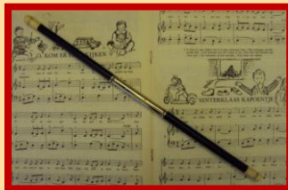
Extra feestelijk dirigeren met zo'n chique stok.