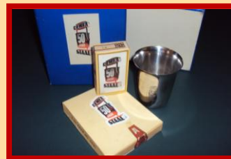
Op de foto natuurlijk niet te zien, maar de doosjes zitten echt nog vol!

Mogelijk kwam het omdat mijn ogen toen zo begonnen te glimmen, dat hij me beloofde dat hij zijn doosje aan het museum zou schenken. Het heeft even geduurd, maar 2 november stapte de heer Boot naar binnen. Naast de vele bescheiden als toegangsbewijs, consumptiebonnen, feestprogramma, die bij de feestelijkheden van '50 jaar Demka Staal' horen, schonk hij ook het doosje met de bijzondere inhoud, 5 sigaren (met Demka-sigarenbandje) en 10 sigaretten!