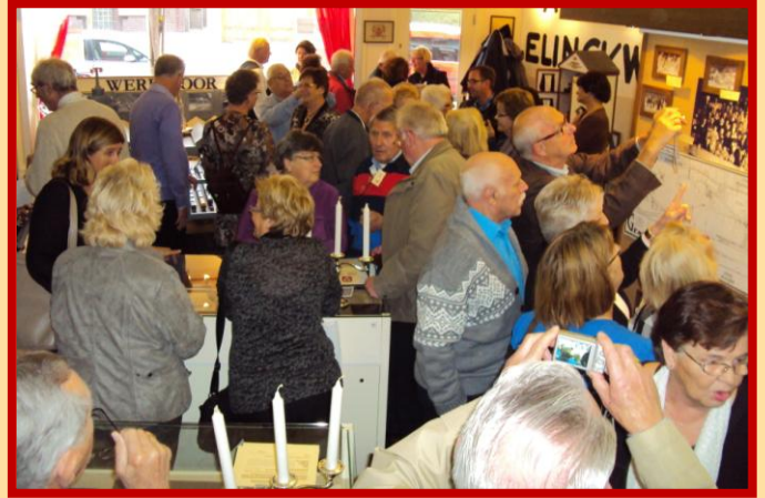
Veel belangstelling tijdens StraatReünie St.-Win(l)fridusstraat

Een voordeel voor u (en ons) is dat u bij de foto's van interessante wetenswaardigheden kunt schrijven, en eventueel ook namen kunt zetten bij de personen die op de foto's staan.