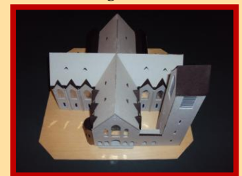
De Ned. Herv. Oranjekerk aan de Amsterdamsestraatweg gemaakt door C. van Kooten.

Last but not... Vlak voor het ter perse gaan van dit nummer kwam de heer van Kooten ons nog even blij maken: hij bracht een door hem vervaardigd schaalmodel van de Oranjekerk, zoals die vroeger was.