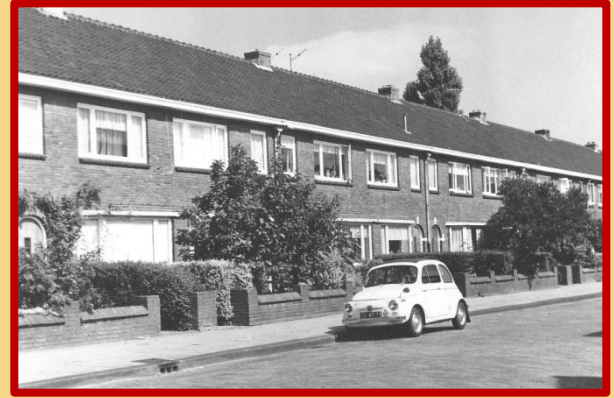
De Bernard de Waalstraat in 1962

Zo ging de reis eens per jaar naar de speeltuin, waar de kinderen op de glijbaan geplaatst werden en de ouders vervolgens lekker koffie drinken. Het doel van die uitstapjes verschilde per jaar. Op 19 augustus 1948 bijvoorbeeld, ging de rit naar de Leusderheide en in 1952 naar de 'Anna's Hoeve' bij Laren. Maar er is nog veel meer over de straat te vertellen. Als u er 'alles' over wilt weten: welkom op 7 juni in het Museum van Zuilen, van 14 tot 17 uur.