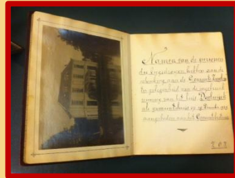
De eerste pagina van het veel gebruikte album

bruikt als gastenboek bij gelegenheid van de opening van de Prinses Margrietschool op 10 januari 1950. Maar toen was het album nog niet vol, dus... bij de opening van Het Schaakwijk op 21 november 1951 werd het opnieuw gebruikt!