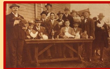
'Een plaatje van het actieven bestuur...'

We kregen nog meer. Een herinneringstegeltje uit 1961 voor de schoolverlaters van de Openbare Lagere School 'Prins Bernhard', een getuigschrift van dezelfde school (maar dan van vóór de Tweede Wereldoorlog, toen de school nog bekend stond onder de naam 'School 2').