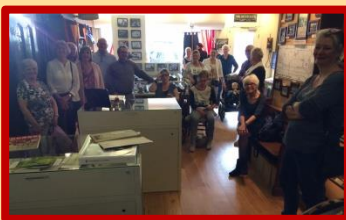
Ook de PowerPoint werd gewaardeerd door de aanwezige leden

En meteen antwoord kregen op de vraag waarom de naam vervangen werd door 'The Roll Dolly's': de lastige vertaling naar het Frans (er werden heel wat optredens verzorgd in Frankrijk) was aanleiding tot deze eenvoudiger naam.