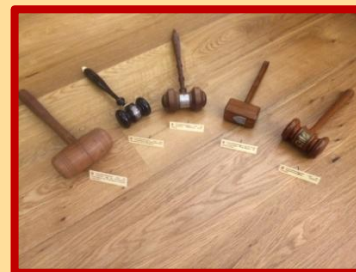
Vijf voorzittershamers: Unie Vrouwelijke Vrijwilligers afdeling Zuilen, Excursieclub Animo (P.V.W.U.), buurtvereniging 'Zuilens Vreug', Vereniging van Adm. Pers. Werkspoor en de Zuilense Winkeliers Vereniging. Ook niet veel eigenlijk, als je weet dat er meer dan 90 verenigingen in Zuilen waren...