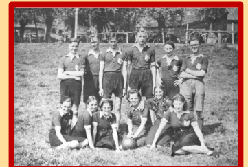
S.M.S. in het eerste jaar van het bestaan

En wat blijkt dan? Bij S.M.S (ze zeggen 'Sport Maakt Sterk', maar de leden wisten wel beter: 'Sjans Met Succes') hebben een aantal leden zelf een gravelbaan aangelegd, met veel tijd en moeite (mooi verslag hierover staat in het clubblad n.a.v. het 50-jarig jubileum).