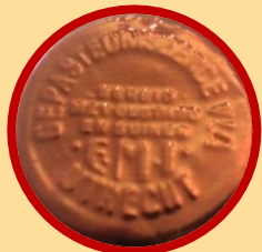
De bruine capsules waren voor de flessen chocoladevla