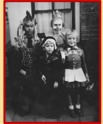
Zuilens Vreugd, kinderen van Scharenburg

Maar... wie weet nog dat de gemeente-arts van Zuilen praktijk hield in deze straat? En hoeveel mensen weten dat ooit, op de hoek van de Edisonstraat (die toen nog Daalseweg heette) de noodkerk St.-Ludgerus gebouwd werd, die na het gereed komen van de grote kerk aan de Amsterdamsestraatweg, nog jarenlang gebruikt werd als parochiehuis? En dat de Buurtvereniging 'Zuilens Vreugd' zijn jaarlijkse feest hield op de Edisonstraat en de kinderen van de leden op de foto gingen op de hoek van de St.-Bonifaciusstraat? En dan hebben we het nog niet eens over de vele krantenknipsels die een mooi beeld geven van de straat. Kortom: welkom, aanstaande zondag! We verwelkomen u vanaf 14:00 uur met een drankje, om 15:00 een kleine lezing over de straat en om 17:00 uur sluiten we af.