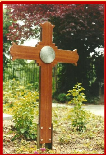
Het Kruis zoals dat lange tijd stond op de Algemene Begraafplaats te Maarssen

April 2010 werd Het Kruis herplaatst, (bijna) naar de plek waar het oorspronkelijk stond, ter herinnering aan de beschieting waarbij drie Verzetstrijders om het leven kwamen. Het was al eens omgetrapt, en daardoor extra stevig vastgemaakt. Ondanks dat werd het twee weken geleden gemist. Het lijkt erop dat het hier om een (volkomen misplaatste!) Nieuwjaarsgrap gaat, (daar hopen we eerlijk gezegd wel op) maar triest blijft het!