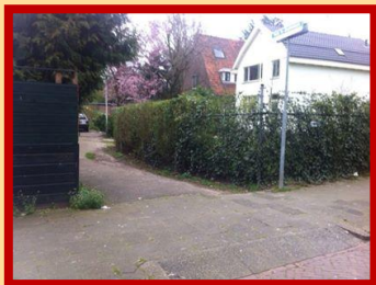
De beide huizen die tegenwoordig uitzien op de achterzijde van de woningen aan de Prins Bernhardlaan

deze twee huizen stonden vroeger met de voorgevel aan de Daalseweg'.