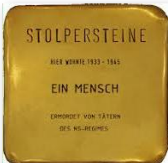
De stenen worden voorzien van naam, geboortedatum, deportatiedatum en plaats en datum van overlijden