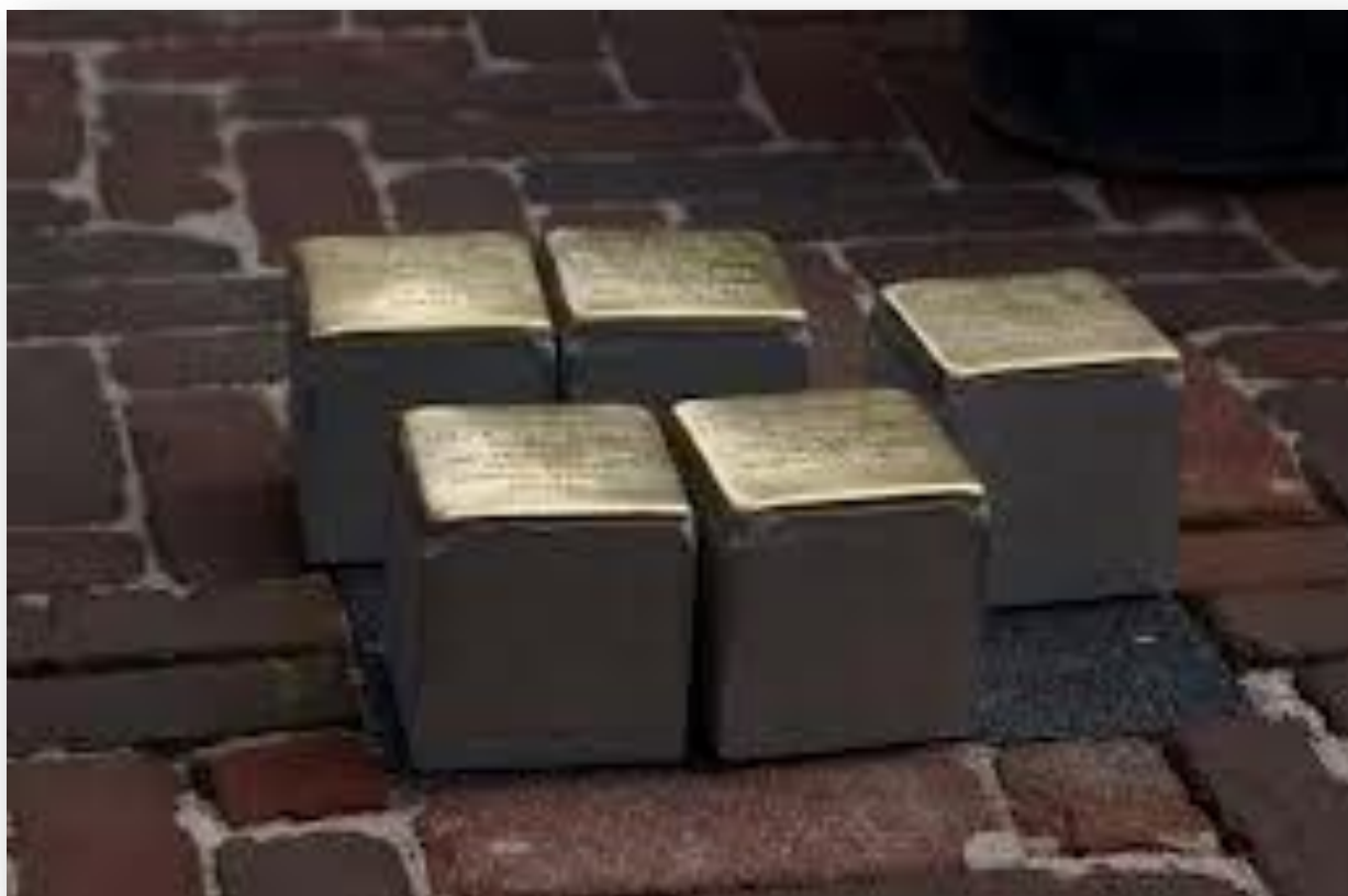
Een aantal stenen, gereed voor plaatsing