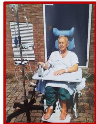
(De directeur kon er niet bij zijn: was herstellende van operatie)