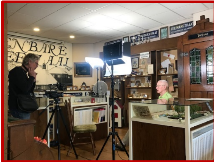
Interview oud-medewerker van Werkspoor, voor vertoning op schermen MvZ 2.0