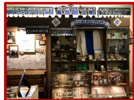
Tentoonstelling 100 jaar Elinkwijk.