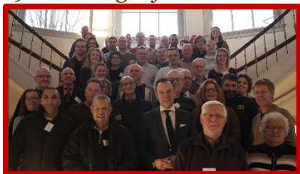
Met z'n allen op de foto in Het Huis

19 Aanwezig bij de welkomstborrel in Het Huis.