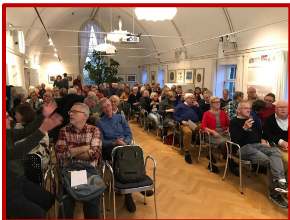
Bezoekers record gebroken volgens de organisatie Vereniging Oud Utrecht

2 StraatReünie op verzoek van de huidige bewoners van de Fultonstraat. 8 lezing in het Bartholomeus Gasthuis over Demka.