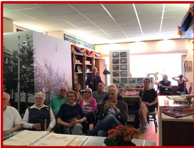
Culturele Zondag Noordwaarts, een hele dag lezingen over Zuilen...

In april ontvangst en lezing over Zuilen voor een groep ouderen uit de wijk Elinkwijk.