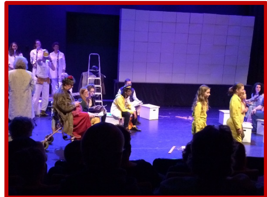
Opvoering van de Slopera in het ZIMIHC theater Zuilen

In april was ook de opvoering van de 'Slopera', over de sloop en herbouw van de omgeving Queeckhovenplein. Ook hiervoor heeft het Museum van Zuilen materiaal aangeleverd.