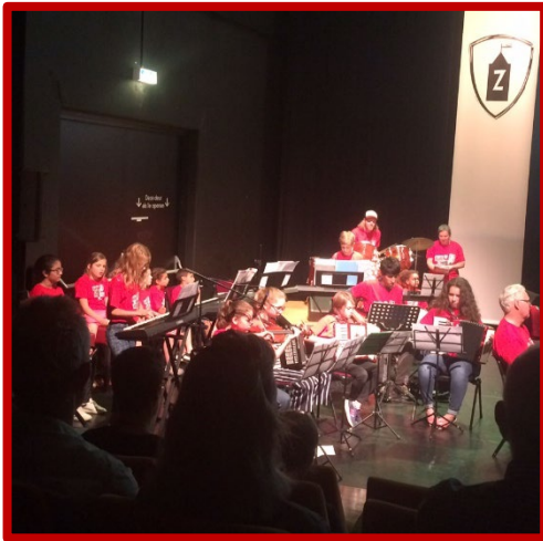
Opname tijdens de opvoering van Kunstkasteel Zuilen.

6 juni was de 'inloopdag' in het Museum van Zuilen van mogelijk geïnteresseerden (Het Utrechts Archief, Centraal Museum, stichting Usine, Het Maliegilde, Blue Yard en anderen voor medewerking, uitleen, opslag e.d. in het kader van het verhuisplan.) In juni was ook de uitvoering (deel I) van Kunstkasteel Zuilen, over de muzikale geschiedenis van Zuilen. Hiervoor heeft het Museum van Zuilen materiaal aangeleverd.