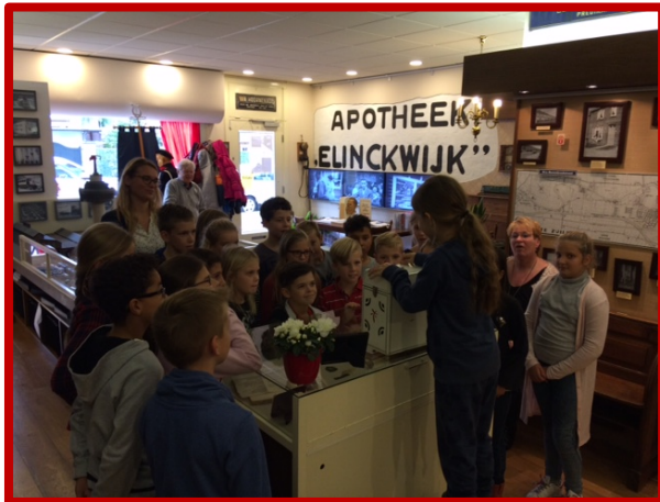
Belangstelling van leerlingen de Piramide, groep 6