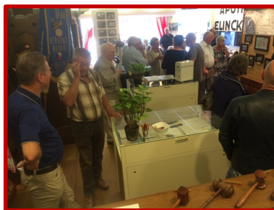
Geanimeerde bezoekers StraatReünie Pedagogenbuurt in augustus

Wekelijks (4x) stukje Zuilense historie geschreven op de site www.zoiszuilen.nl