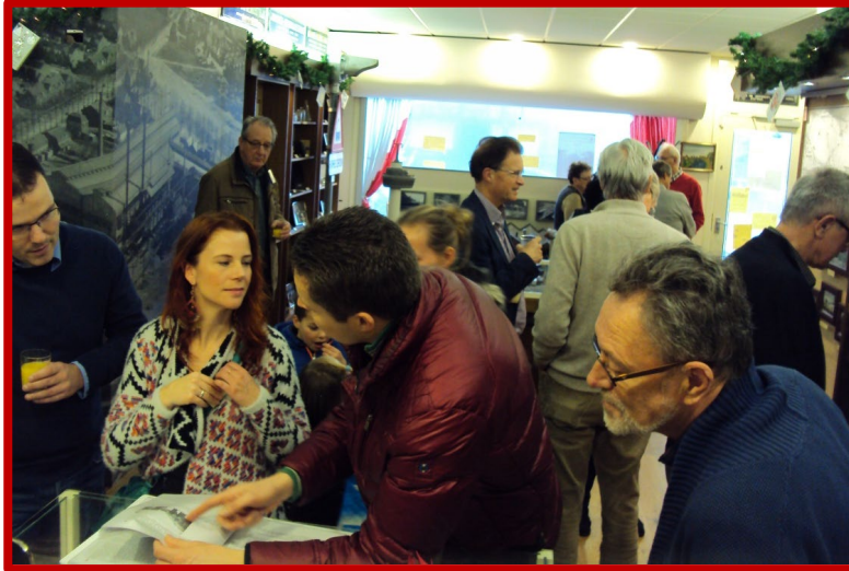
Enthousiaste bezoekers van de StraatReünie voor de Clement van Maasdijkstraat