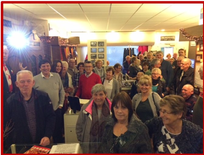
Grote opkomst eerste ClubReünie voor oud-leden van S.M.S.

12 december geïnterviewd in het ZIMICH-theater buurtinitiatief Het Glazen Buurthuis Brief gezonden aan Tatasteel voor financiële bijdrage voor vervangende schaakstukken van Corte staal