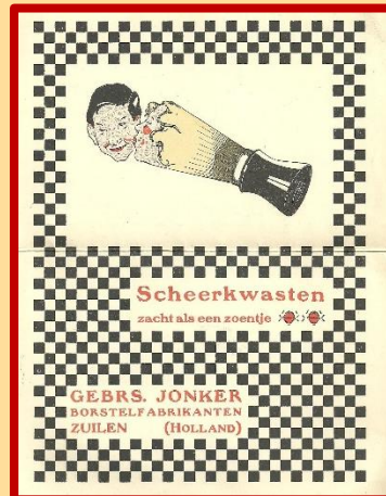
Reclamekaart van de fabriek voor de promotie van scheerkwasten.