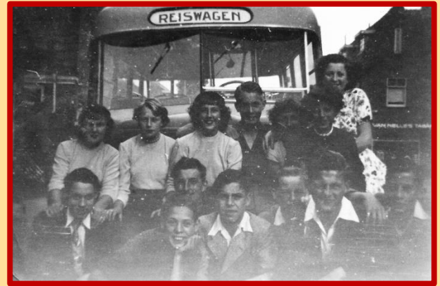
Kort voor het vertrek nog even op de foto