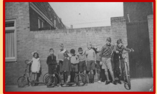
Jeugd uit de Adelboldstraat

En om het 'Museumweekend' compleet te maken gaat zaterdag 3 november de StraatReünie Bessemerlaan op herhaling. Daar hebben wij (en nog 'een paar' andere bezoekers van de vorige keer) ook nog hele goede herinneringen aan!