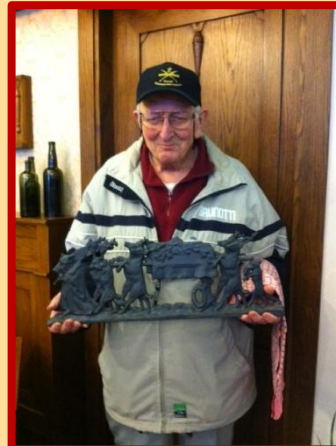
De begrafenis van de jager: voorop loopt een zwijn met de schep, achter hem een varken en een hert. Daarachter vier herten die de kist dragen waarin de jager ligt. Onder de kist loopt nog een haas (die draagt de rouwkrans) en de stoet wordt afgesloten door een vos

magazijn H. v. Veenendaal' uit de St.-Winfridusstraat)