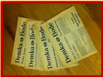
Vier Demka Bode's die we nog niet kenden

De tentoonstelling was er natuurlijk debet aan, maar we kregen de afgelopen weken weer heel veel mooie dingen ter uitbreiding van de collectie.