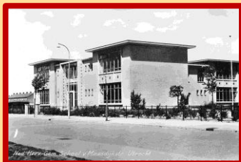
De Ned. Herv. School aan de C. van Maasdijkstraat

En dan wist u ook niet dat in deze straat de Ned. Herv. School 4 (ook een ontwerp van W.C. van Hoorn) gebouwd werd.