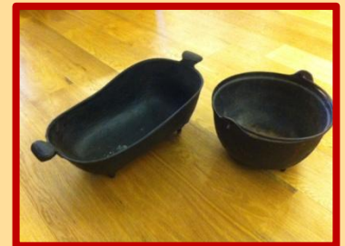
De laatste aanwinst (van dit jaar???) gietijzeren pan en houtbak, bij Werkspoor gemaakt