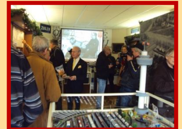
Zoeken naar bekende collegae tijdens de Demka-Reünie

De Demka-Reünie was een succes, voor ons, maar ook voor de vele bezoekers. Voor ons aanleiding om voor het kantoorpersoneel een aparte Reünie te organiseren: 16 maart 2016, ook van 14 tot 17 uur en natuurlijk ook weer in het Museum van Zuilen. (u mag dit bericht gerust doorsturen naar Demka-relaties, dank u wel)