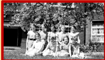
Een van de ruim 1600 foto's die het Museum van Zuilen kreeg van een zoon van de heer Osinga

En dan wist u ook niet dat de heer Osinga als hobby graag fotografeerde, alle leerlingen van de school op de foto zette, maar ook tijdens het schoolreisje, of tijdens Sinterklaas op school.