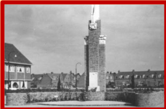
Het Vliegermonument kort na de oplevering. De woningen in de A.H.G. Fokkerstraat moeten nog gebouwd worden