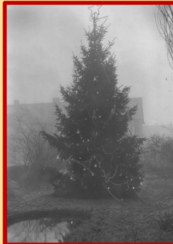
Mariëndaals Belang ijverde (al in 1952) met succes voor een kerstboom in de wijk